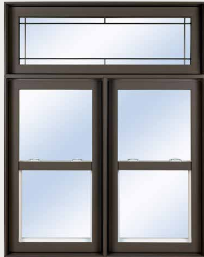
Assemblage guillotine et auvent black 8629