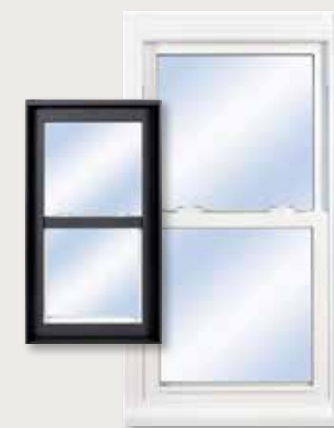
Fenêtre à guillotine