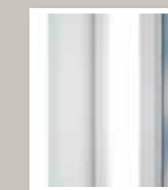
Profilé PVC contemporain