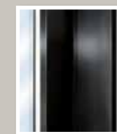
Profilé ALU contemporain