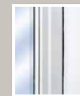
Profilé PVC colonial

Battant ou Auvent | Guillotine simple | Coulissant simple