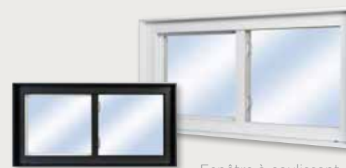
Fenêtre à coulissant